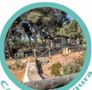
Callosa de Segura